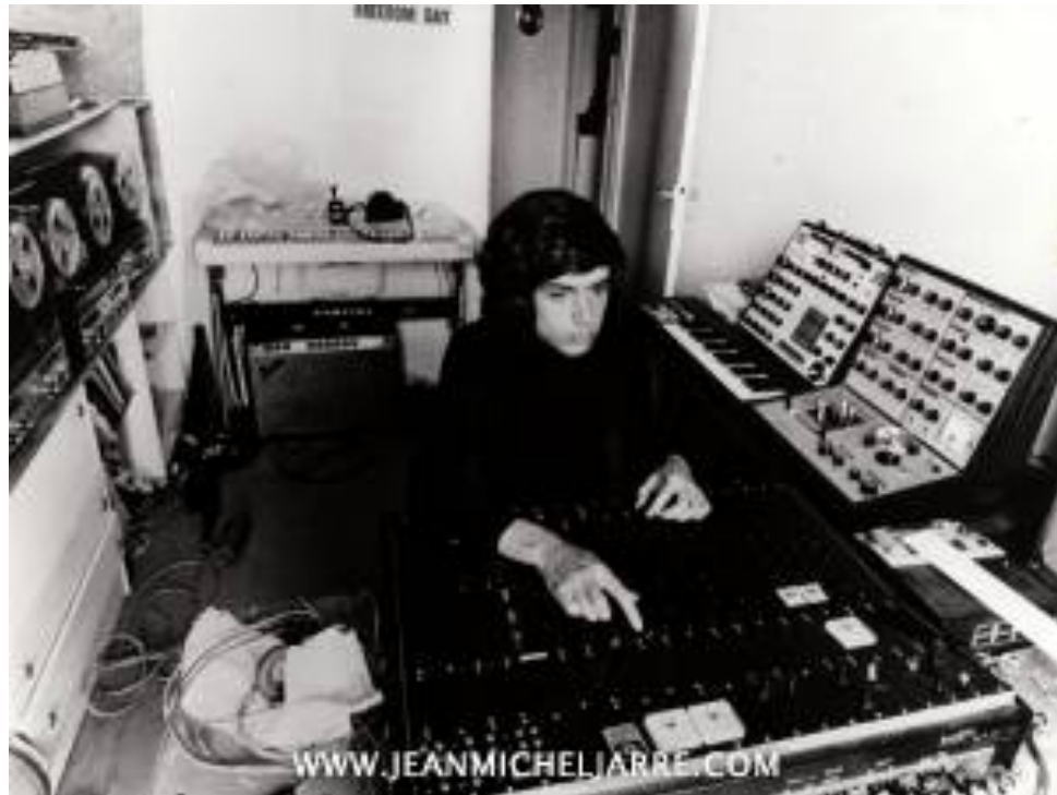
Jean-Michel JARRE dans son studio (année 70) avec ses EMS VCS-3 (en haut à droite)

Jean-Michel Jarre a composé son premier 33 tours avec un seul VCS-3 : son premier synthétiseur. Il compose également la musique de son ballet AOR en 1971 à l'aide de cet instrument.